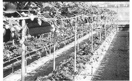
■西島園芸団地 (花と果物の楽園)