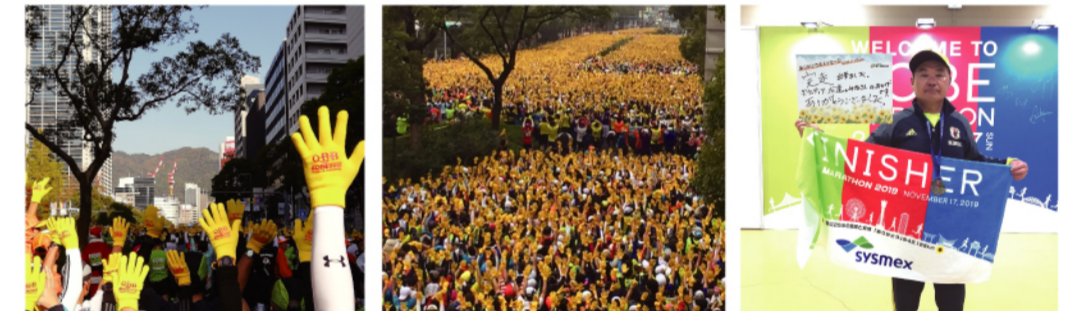
「感謝と友情」のひまわりが、見事に咲きました。

「第9回神戸マラソン2019」が、11月17日に開催されました。「感謝と友情」をテーマに東北や熊本などの被災地からも約2千人が参加しました。約2万人のランナーが神戸市内を駆け抜けました。沿道には約61万人の市民が詰めかけ声援をいただきました。