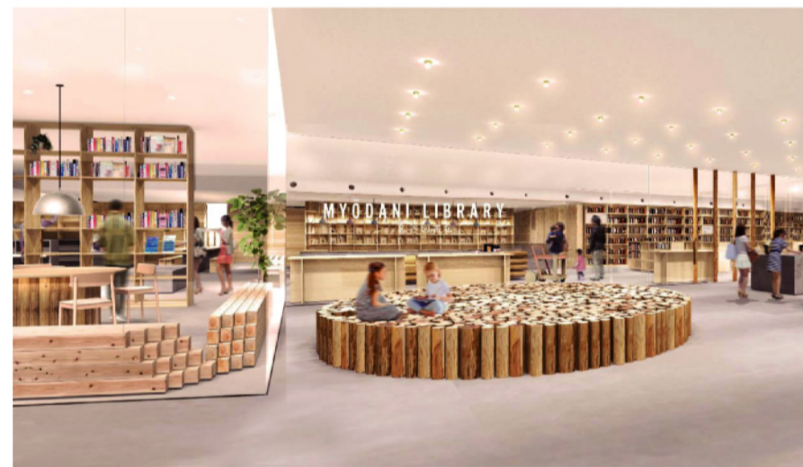
— エントランスと雑誌コーナー —