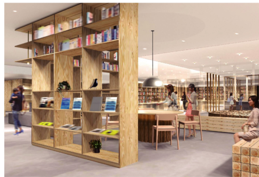
— 一般書コーナー(木質系の本棚や机・座席を使用) —