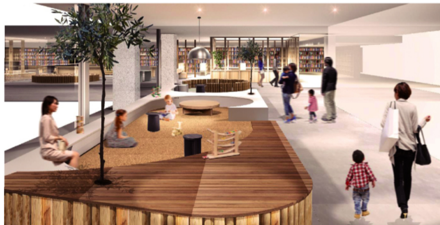
— エスカレーター横のキッズコーナー(図書館休館日も開放予定) —

児童図書コーナーに靴を脱いで座って過ごせる場所や、読み聞かせのイベントなどを行うおはなしの部屋を設けるほか、図書館の外側には飲食しながら自由に過ごせるエリア(キッズコーナー)を用意。