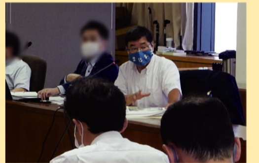
7月6日の建設防災委員会にて

第二波の新型コロナウイルス感染症の発生が危惧されています。と同時に暑さによる熱中症にも十分注意してください。気を緩めることなく「三つの密」の回避や「人と人との距離の確保」、「マスクの着用(熱中症に注意しながら)」、「手洗いなどの手指衛生」をはじめとした基本的な感染対策を継続して頂き、感染拡大を予防する「新しい生活様式」を実践していただけますようよろしくお願いいたします。